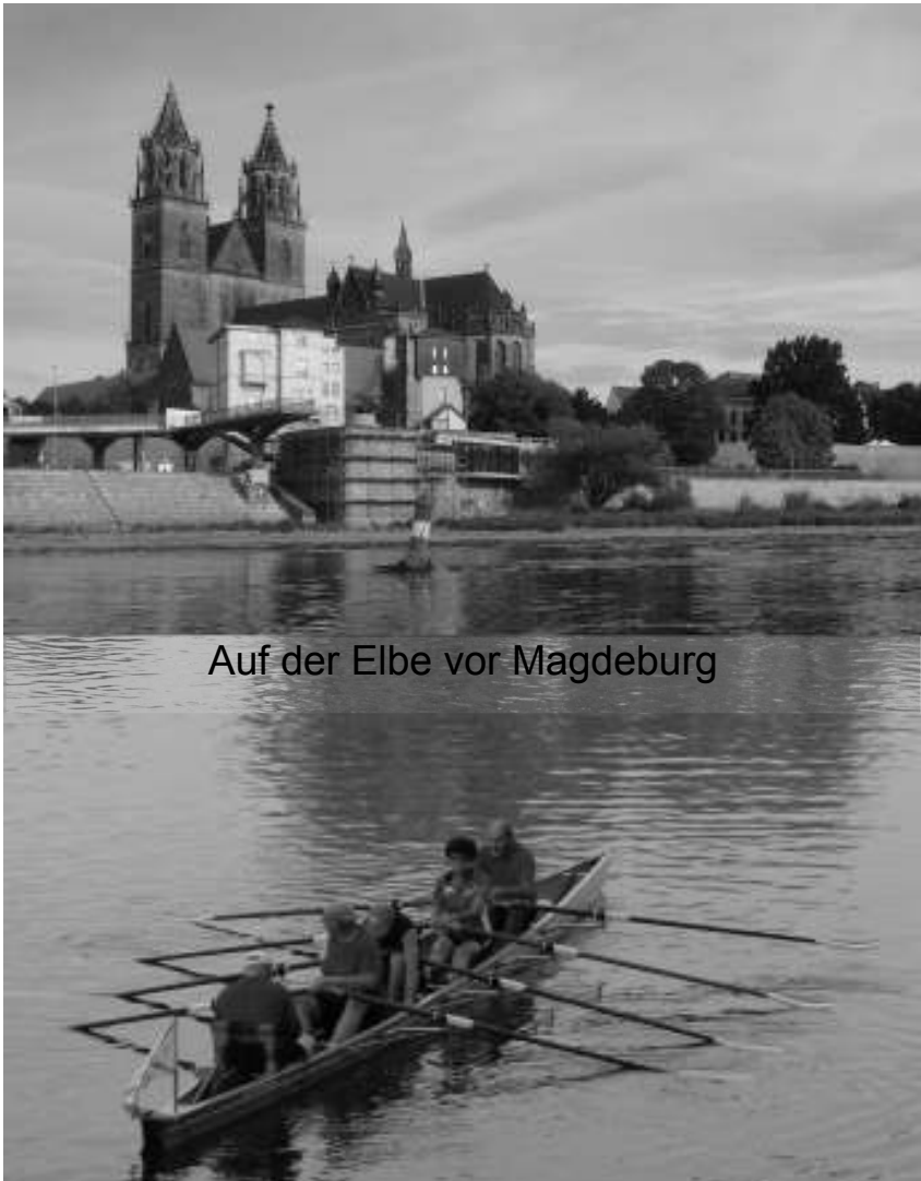
Auf der Elbe vor Magdeburg