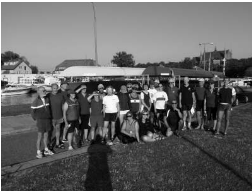
Am Ziel in Fromborg/Frauenburg